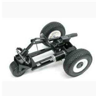
Rígido o plegable

“Garantizamos el mejor precio del mercado en todos nuestros vehículos eléctricos y un servicio postventa excepcional.”