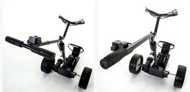
Empuñadura en forma de T o recta