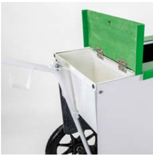
Caja de objetos

Al ser fabricantes, nos adaptamos a cualquier tipo de requerimiento necesario según su aplicación final: caja de objetos personales, cubo de basura, porta escobas, porta paraguas y USB, etc.