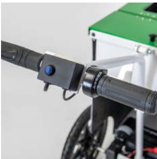
Acelerador con botón de seguridad